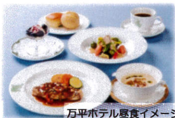
万平ホテル昼食イメージ