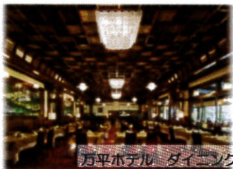
万平ホテル ダイニング

内装、調度品、その雰囲気にも古き良き社交場時代の面影を残すメインダイニング。レトロな空間で、伝統のレシピを守り進化を続ける絶品フレンチをお楽しみください。